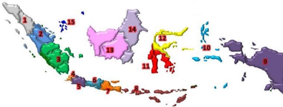
Gambar 1. Pembagian Zona Layanan Multipleksing